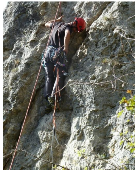
Atelier 2 : escalade artificielle, pose de coinceur, montée sur étrier et à l'aide d'une longe ropeman