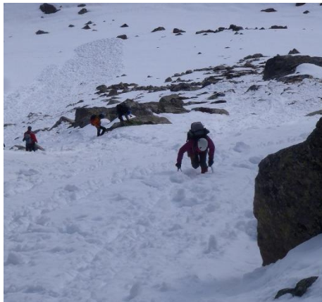
Approche sans encordement jusqu'à l'entrée du couloir