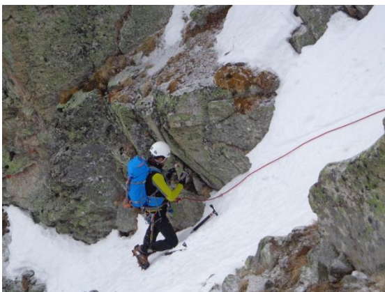
Jean-Gabriel récupère les points de protection