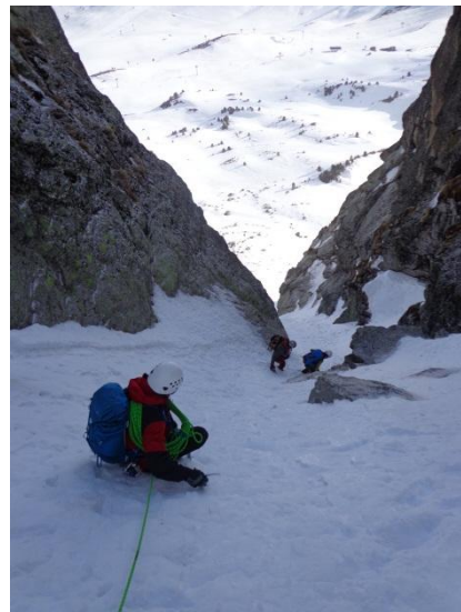
La descente, en encordement court, voir en assurance relais debout sur piolet