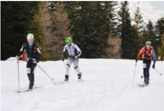
Les coureurs au taquet lors de la première boucle