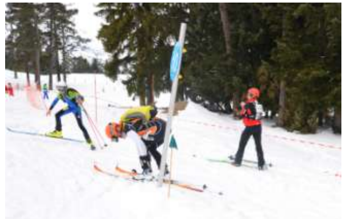
La première zone de dépeutage : enlever les peaux, les glisser sous la combi et se mettre en mode descente le plus vite possible... même pas 20s pour les bons !!!